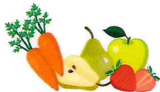
ФРУКТЫ И ОВОЩИ