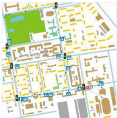
Схема организации дорожного движения в непосредственной близости от образовательного учреждения с размещением соответствующих технических средств, маршруты движения детей

Маршруты движения организованных групп детей от образовательного учреждения к стадиону, парку или спортивно-оздоровительному комплексу